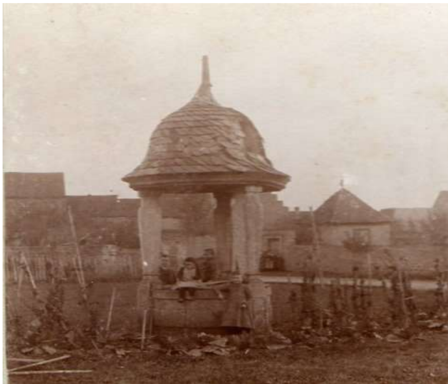
So sah der jetzt überbaute Brunnen („Rimbacher Brunnen“) im Kindergarten mal aus.

Natürlich hatten einige Anwesen eigene, private Brunnen. Ein schönes Exemplar hat sich in der Hauptstraße Nr. 11 erhalten. Noch älter und kunstvoll mit Bruchsteinen eingefasst ist der ehemalige Ziehbrunnen im Kindergartenneubau. Er hieß mal „Rimbacher Brunnen“; denn in der Fortsetzung in Richtung Nordheim befand sich die Siedlung „Ronebach“, die im 17. Jahrhundert aufgelassen wurde. Glücklicherweise hat man ihn bei den Erweiterungsbauten vor einigen Jahren nicht zugeschüttet, sondern eine dicke Glasplatte darübergerlegt. Beim Darüberlaufen können die Kinder an einen geheimnisvollen oder verwunschenen Märchenbrunnen in der Tiefe denken.