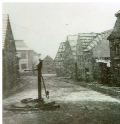
Mitten in der Straße: Der Brunnen in der Unteren Winzerstraße.