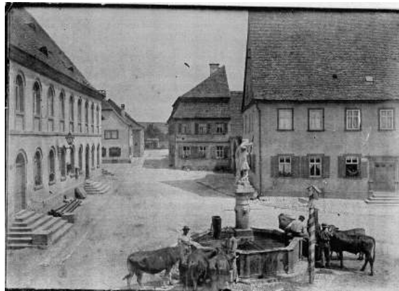
Der Vierröhren-Brunnen um 1903. Zu sehen sind auch schon die Rohre für die neue Wasserleitung.

Jetzt im Frühling sprudeln wieder die Brunnen, die zur Osterzeit dazu noch wunderbar geschmückt werden. Diese Tradition erinnert u.a. daran, wie wichtig, ja überlebenswichtig die Brunnen für Mensch und Tier einst waren. In Sommerach ist es nur einziger, der Röhrenbrunnen mit dem heiligen Georg auf dem Sockel, der noch Wasser führt. Früher schöpfte man daraus Trinkwasser und die Kühe wurden dort getränkt.